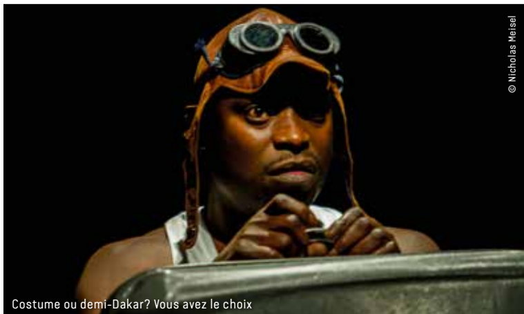
Costume ou demi-Dakar? Vous avez le choix

ORANGERIE – THEATER IM VOLKSGARTEN KÖLN | 20. Juni, 21.00 Uhr | Arbeits-Präsentation | VVK 15 € / 10 € (erm.), AK 20 € / 13 € (erm.)